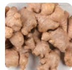
ショウキョウチンキ